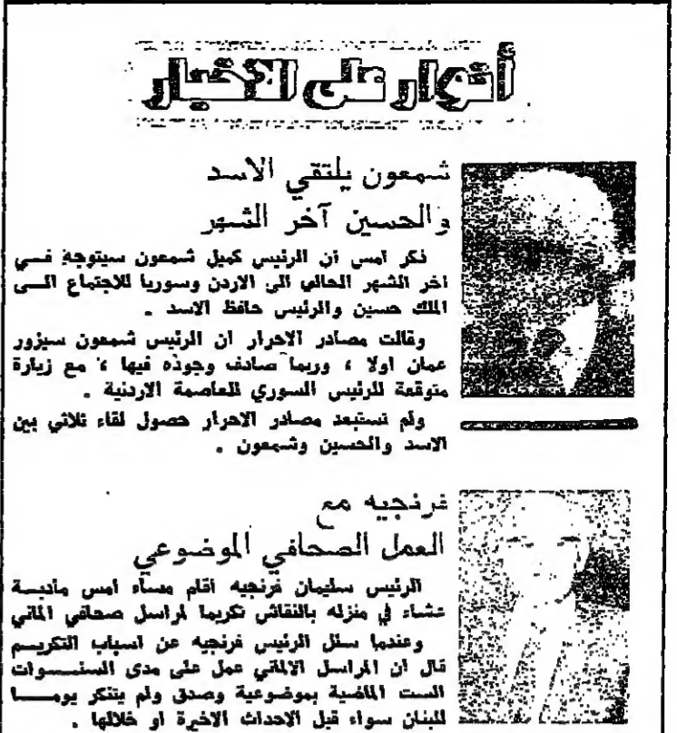
شعومون يلتقي الاسد والحسين آخر الشهر

بمساءة الجنوب قتلها واردها للزرة المانة ، بأنه يقبها قوة ردع ، وذلك لردع الجاسوس والسيول والجبرم والاص ، لان هذه القوة لا تردع وان تردع بالوظة ، وقد اخفنا احدات السنين هذه الفترة ، فكلت كلبا هذات احدات في لبنان تعود هذه القوة لتضعها لان ليس لها صفة باستتباب الامن والاستقرار ، وما كان يحدث في لبنان يحدث اليوم نسي الجنوب ، لذلك يجب ارسال قوة ردع الى هناك ، ولا يهم ان تكون لبنانية او عربية او دولية ، اتسا المهم ان تكون زينة وشريفة وصانعة ومتجردة في مهلة ، واذا لم ترسل قوة ردع الى الجنوب كيف نطق بلاننا نستطيع ان نتهي الحالة هناك ؟ شعومون : اما الرئيس كميل شعومون فقد ادلى بضمير قال فيه : منزل كاطم بك الخليل هو منزلي ، وآثوره تاناسا وباستمرار ومن الطبيعي في كل مرة تزوره فيها ان تستعرض الاوضاع العامة في البلاد . وسئل الرئيس شعومون : ماذا من جديد على صعيد معالجة الوضع في الجنوب ، فأجاب : الوضع في الجنوب ما زال تحت المدرس ، وان ازيد من ذلك شيئاً اليوم . وسئل : هل تعتقد بان ارسال قوة مجهزة من الامم المتحدة الى الجنوب تستطيع ان تحل المشكلة هناك ، فأجاب : هذا الموضوع من جسطه الموضوع التي تحت المدرس الان .